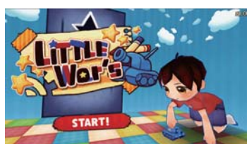
☆2016年度 新人研修課題 (3D/Unity) 作品『Little War's』

☆どちらも、App Store / Google Play にて無料配信中! デベロッパー名: Sol-tribe Co., Ltd / ソルトライブ株式会社