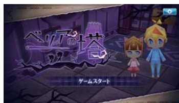
☆2016年度 新人研修課題 (3D/Unity) 作品『ベリアの塔』

ソルトライブでは、これらすべてが「未来につながる」一歩だと考え、ひとりのクリエイターのスキルアップが将来の業界の発展につながることを確信し「育成して共に歩む」姿勢として推進しています。